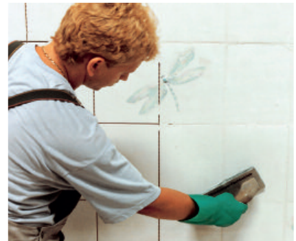
Mit PCI FT Fugengrau und PCI FT Fugenweiß können Fugen von 2 bis 8 mm Fugenbreite rissefrei verfugt werden.