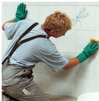
Den verbliebenen Mörtelschleier mit einem feuchten Schwamm entfernen.