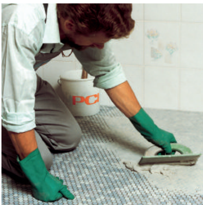
PCI-Fugenmörtel mit Gummifugscheibe bündig in die Fugen einbringen.

4 Nach dem Abtrocknen den verbliebenen Mörtelschleier mit einem feuchten Schwamm entfernen. Bei der Reinigung keinen trockenen Lappen verwenden, da Verfärbungsgefahr durch Einreiben von angetrocknetem Fugenmörtel in die noch feuchte Fuge besteht.