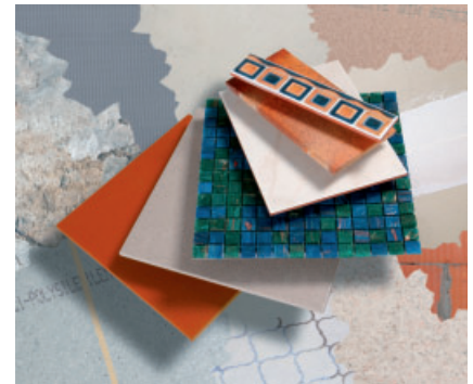
Variables Leistungsspektrum – für alle Untergründe und alle keramischen Beläge.