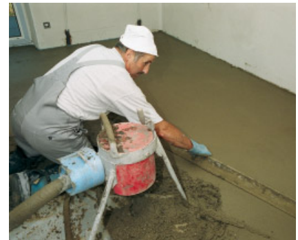
Mit Estrich-Schnellzement PCI Novoment Z1 hergestellte Estriche sind bereits nach ca. 3 Stunden begehbar und schon nach ca. 1 Tag mit keramischen Belägen belegbar.