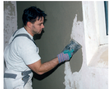
PCI Pericret lässt sich sehr geschmeidig verarbeiten - in Schichtdicken von 3 bis 50 mm.